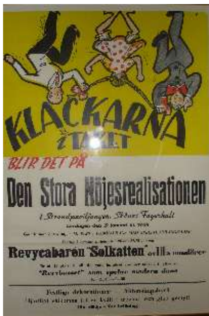
Föreningens kabarégång uppträdde inte bara för "de närmast sörjande"