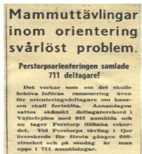
Problemet var inte hur arrangören skulle klara ett stort deltagarantal, utan det handlade i stället om hur deltagarna skulle kunna ta sig till tävlingsplatsen