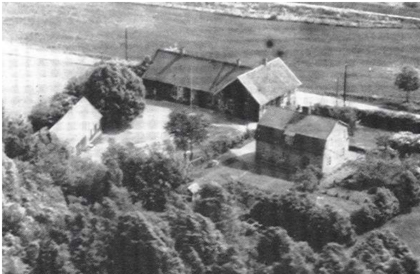
Föreningen anordnade revyaftnar i Espets skola