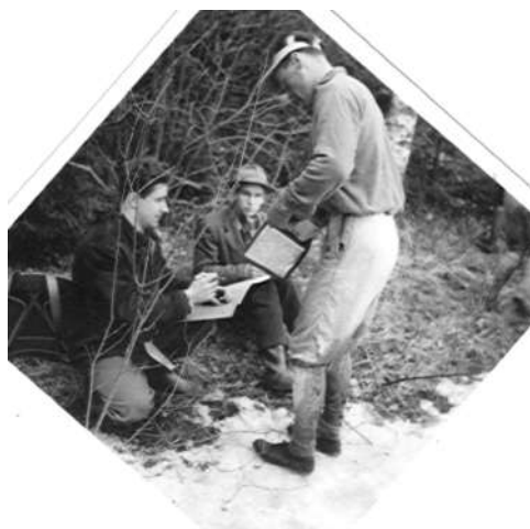
En typisk bild från en kontroll. Kontrollanten signerar kontrollkortet och skriver en tidlista. Löparen måste ta fram sitt kort vid varje kontroll.

Jub. 20 berättar att intensiteten i friidrott ökades 1953-54.