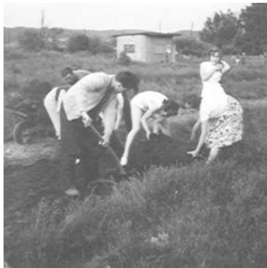
Arbete på den "berömda" Åvallen Observera omklädningsbaracken på vänstra bilden