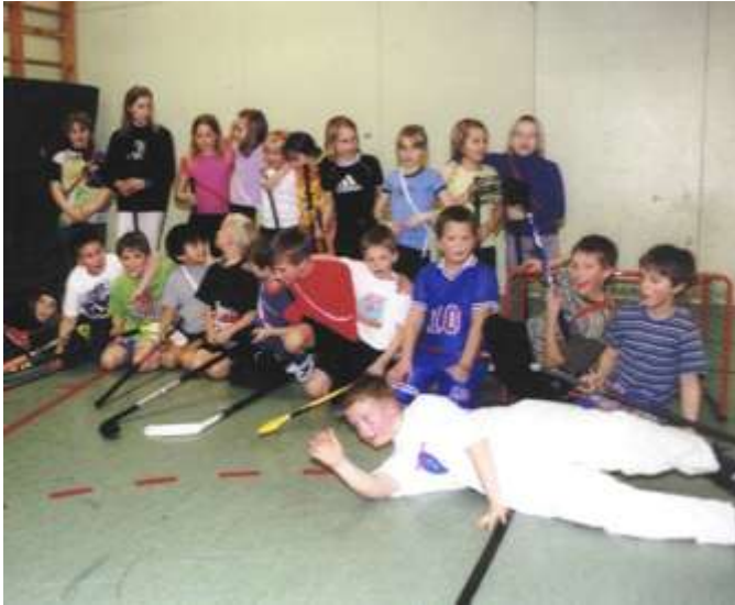
Avslutning på ungdomarnas innebandyträning

OL-träning hade bedrivits en gång i veckan vår och höst. Vintertid hade man konditionsträning varje onsdag (med fika). Innebandyträning med två grupper skedde i skolan. Vid samtliga träningar hade man många ungdomar.