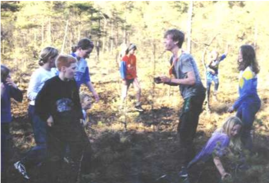
En höjdpunkt för ungdomarna var "måsa fotbollen"