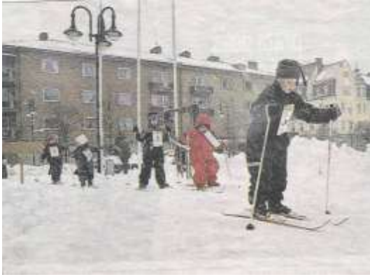
Föreningen arrangerade Barnens Vasalopp på Stortorget i samarbete med Skånes Skidförbund och Hessele City