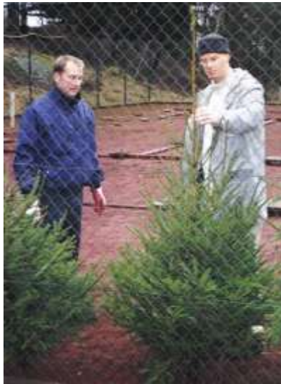
Julmarknad med försäljning av julprylar