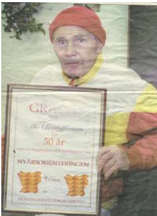
Alte hyllades för sin sista och milleniets första tävling