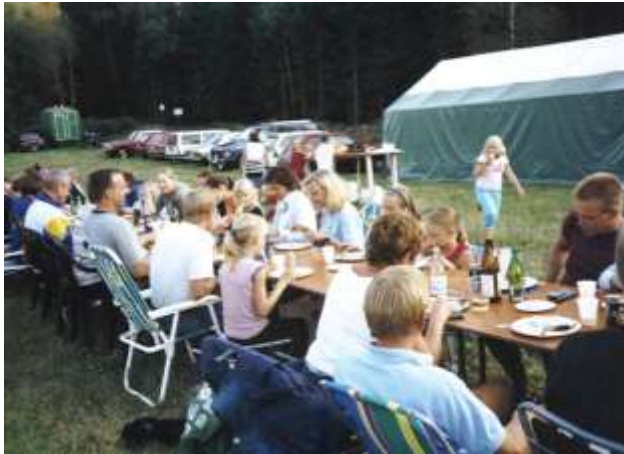
Funktionärsfesten genomfördes som vanligt kvällen före tävlingen.