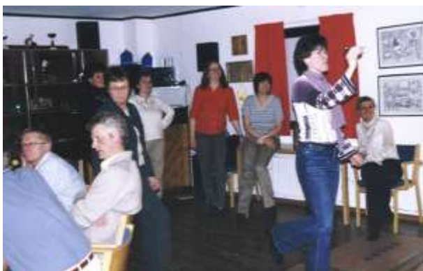
Pubafton med mat dryck och dart